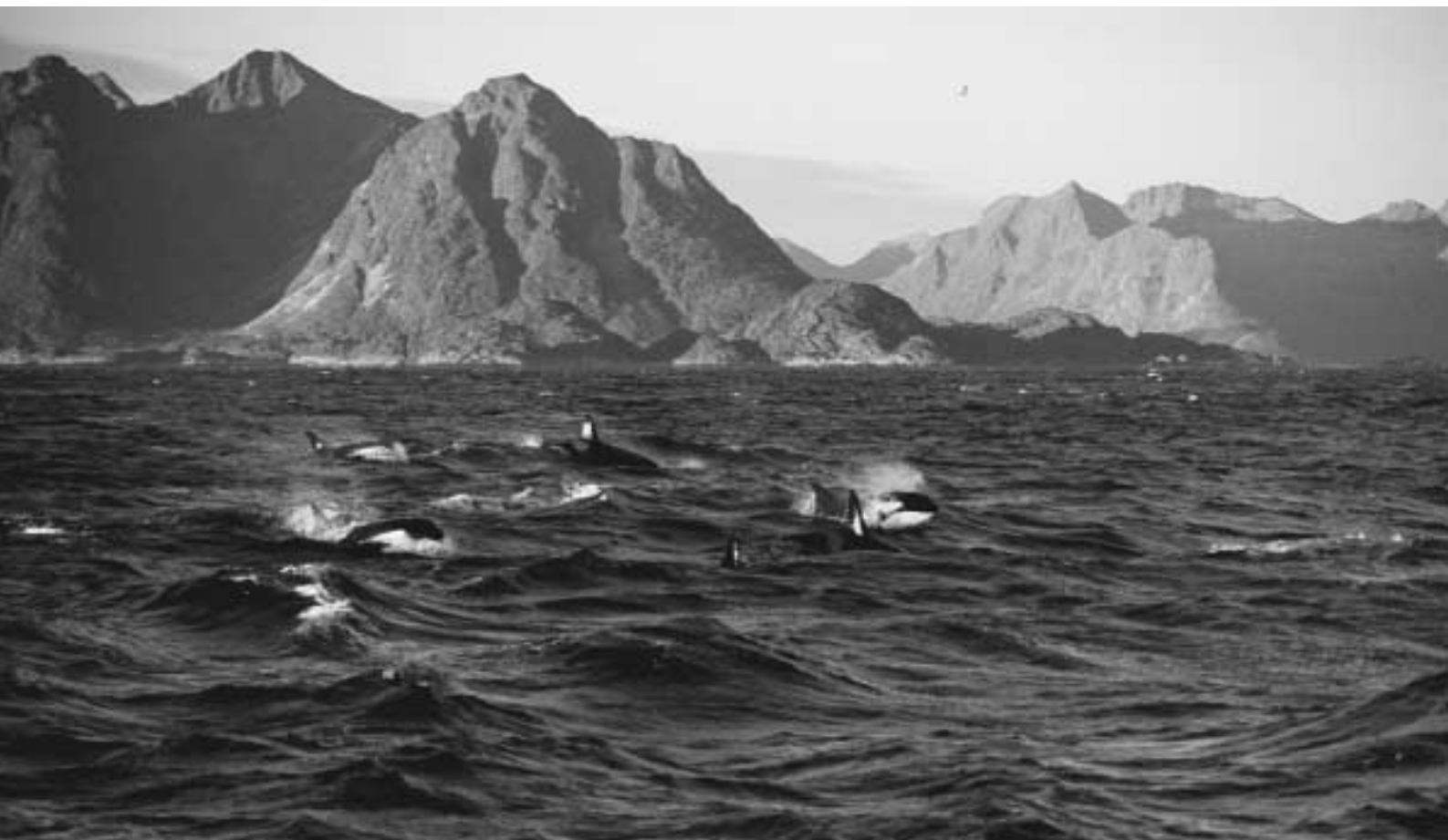
Späckhuggare vid Lofoten.

Vi lyckönskar Islands valskådningsarrangörer och Greenpeace i sina försök att stoppa den helt onödiga och helt otidsliga valjakten.