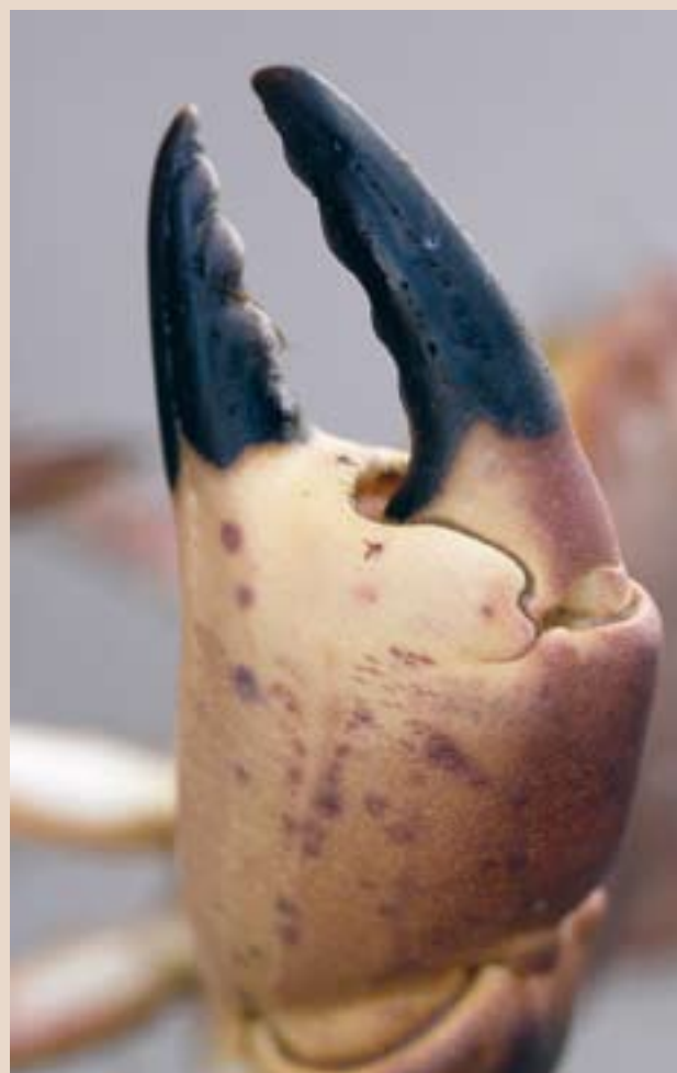
Ännu en klo till Naturens Bästa